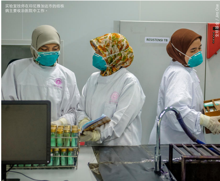
实验室技师在印尼雅加达市的结核病主要收治医院中工作。